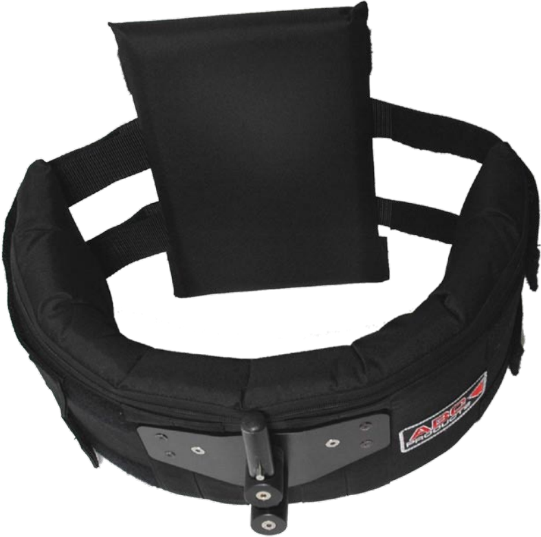
2. Spring-arm (single or double)